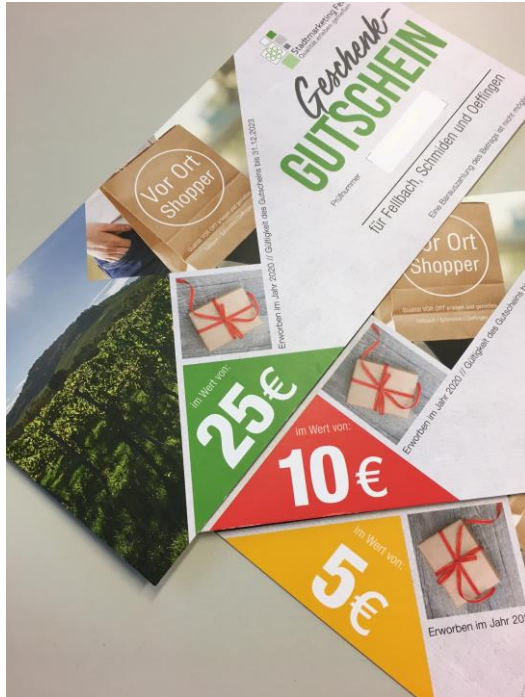
Abbildung 5: Einkaufsgutscheine

Euro erhältlich. Arbeitgeber können die Arbeitgeberversion direkt beim Stadtmarketing Fellbach in den Werten 10 Euro, 25 Euro und 44 Euro erwerben. Diese Gutscheine können Mitarbeitern als steuerfreie Sachzuwendung geschenkt werden. Beide Gutscheine können bei zahlreichen Geschäften in Fellbach, Schmiden und Oeffingen eingelöst werden. Die Geschäfte reichen im Anschluss die Gutscheine beim Stadtmarketing ein und erhalten den Gutscheinwert innerhalb weniger Tage erstattet. So wird die vorhandene Kaufkraft auch in schwierigen Zeiten aktiv in Fellbach gehalten.