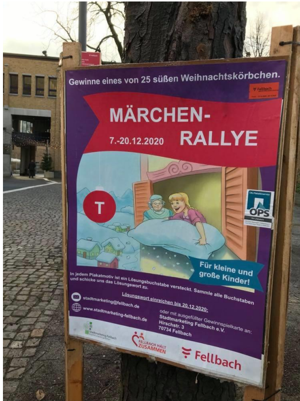
Abbildung 6: Märchen-Rallye 2020

In der Woche vor Weihnachten fanden, fast schon traditionell, die Richtigparker im Stadtgebiet einen kleinen schokoladigen Weihnachtsgruß an der jeweiligen Windschutzscheibe.