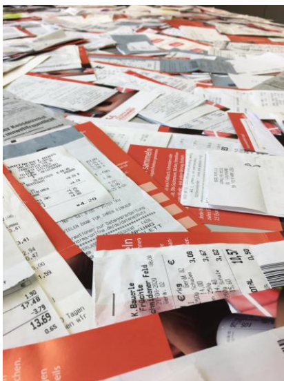
Abbildung 2: Rückmeldungen Kassenzettel-Jagd

Bei allen Aktionen wie der Bilder-Rallye, der Kassenzettel-Jagd, dem Fellbacher Stadtklavier oder Taschenaktionen auf dem Wochenmarkt war das Ziel, das Gemeinschaftsgefühl in Fellbach zu stärken und trotz aller Einschränkungen die Betriebe vor Ort in den Fokus zu rücken. So konnten bei einer Social Media Bilder-Rallye das eigene Lieblingsgeschäft fotografiert und unter dem Hashtag #Fellbachhältzusammen gepostet werden. Bei der Kassenzettel-Jagd konnten im August Kassenzettel aus Fellbach beim Stadtmarketing abgegeben werden. Unter allen Einreichungen wurden Einkaufsgutscheine verlost.