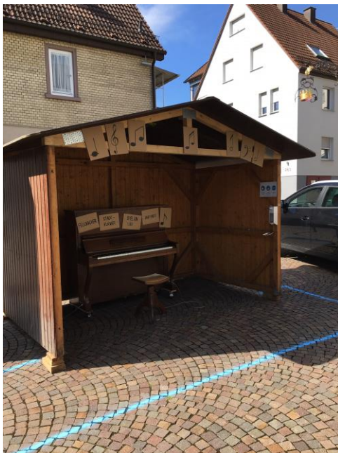
Abbildung 3: Fellbacher Stadtklavier

Die Fellbacher Stadtklaviere luden an den drei Standorten zum freien musizieren ein und bei den Taschenaktionen auf den Wochenmärkten wurden Werbemittel und kleine Geschenke der ansässigen Geschäfte an die Wochenmarktbesucher verteilt. Aufgrund der im November erneut bestehenden Einschränkungen konnten das neue Format „ Einblicke “ nicht durchgeführt werden. Hierbei besuchen interessierte Bürgerinnen und Bürger an einem Abend nacheinander drei Betriebe und lernen diese bei einem Blick hinter die Kulissen kennen. Sobald diese Formate wieder möglich sind, werden die Einblicke stattfinden.