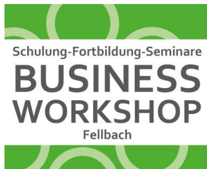
Abbildung 7: Business Workshop

Auch im Jahr 2020 waren erneut drei Business Workshops geplant, wobei coronabedingt lediglich zwei davon durchgeführt werden konnten. Noch vor dem Ausbruch im März konnte ein Workshop rund um das Thema Lebensmittelhygiene an Veranstaltungen angeboten werden. Der Workshop wurde in Kooperation