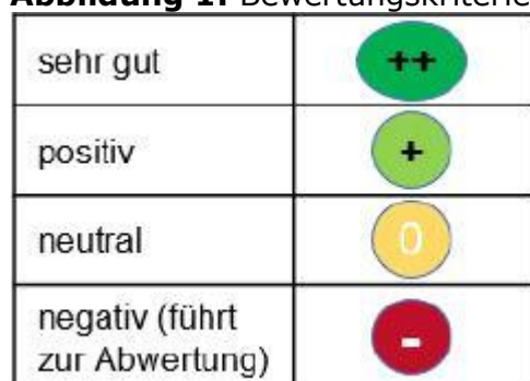
Abbildung 1: Bewertungskriterien Nutzwertanalyse

Die Ergebnisse der Nutzwertanalyse sind in Tabelle 7 dargestellt. Insgesamt weist der Bestand ein positives Ergebnis auf. Ebenso erzielt Konzept Variante 4 , die sich stark am Bestand orientiert, ein positives Ergebnis. Bei Konzept Variante 2 und Konzept Variante 3 ergeben sich durch die langen Fahrwege und hohen Kosten insgesamt eine negative Bewertung. Zusätzlich ergeben sich bei Konzept Variante 3 mit der Führung der Linie 215 über die Hintere Str. Probleme mit der Befahrbarkeit. Konzept Variante 1 wird insgesamt eine neutrale Bewertung zugeordnet. Dabei gilt es allerdings zu beachten