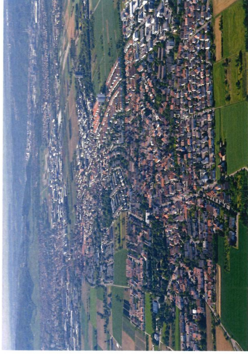
Blick über Oeffingen (unterer Bildrand), Schmiden (Bildmitte) und Fellbach (oberer linker Bildrand).

Diese Broschüre bietet einen Überblick über die abgeschlossenen Maßnahmen und verdeutlicht anschaulich die positive Wirkung, die eine Maßnahme der städtebaulichen Erneuerung entfalten kann.