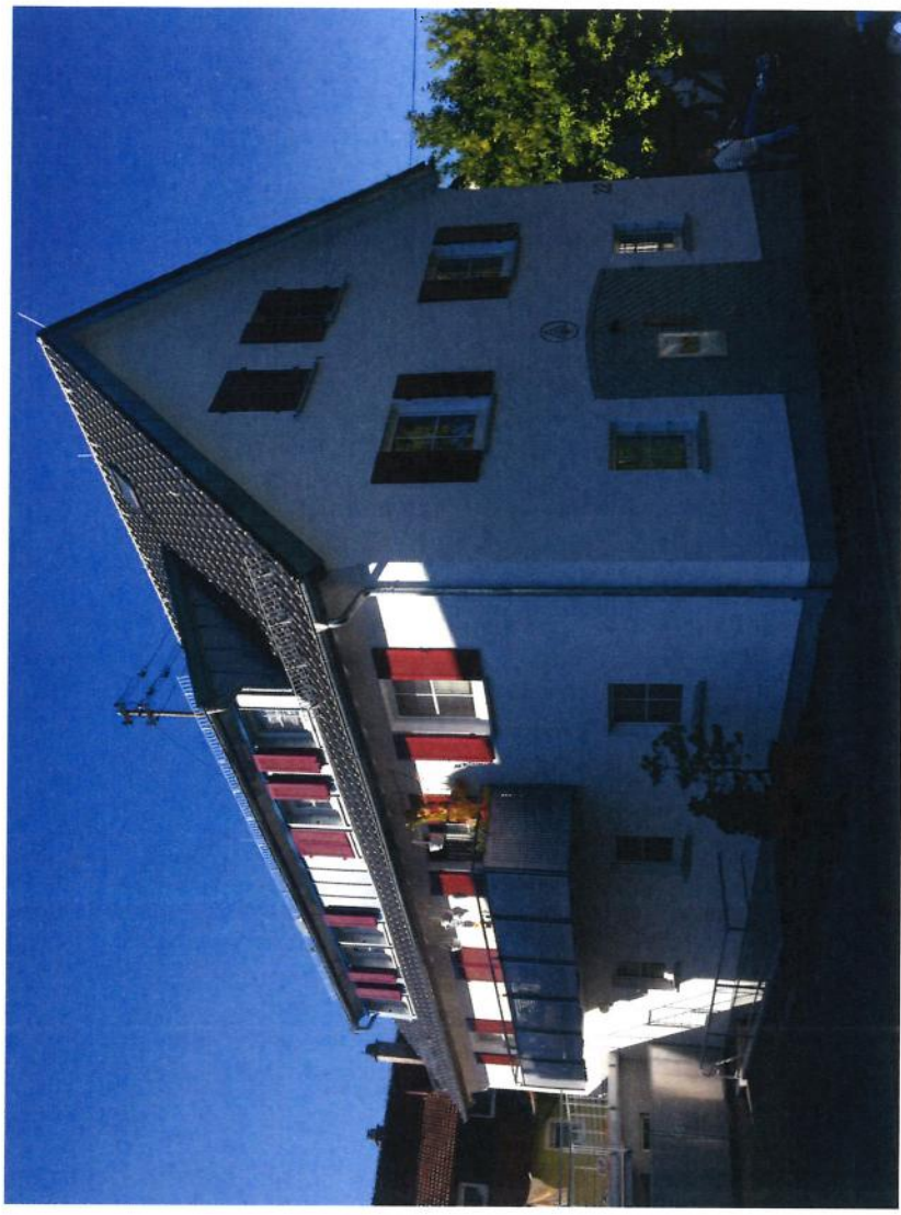
Modernisiertes Wohngebäude Uhlandstraße 22

Durch die konsequente Verfolgung der Sanierungsziele seit Beginn der Maßnahme im Jahr 2009 konnten deutliche Erfolge erzielt werden. Durch die Umsetzung sowohl privater als auch kommunaler Maßnahmen konnte die Sanierungsmaßnahme zur positiven Entwicklung von Schmiden beitragen.